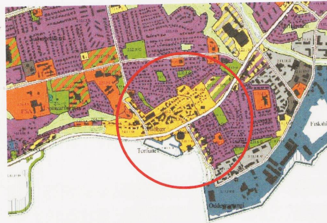
Aðalskipulag Akureyrar 2005-2018 (hluti uppráttar)